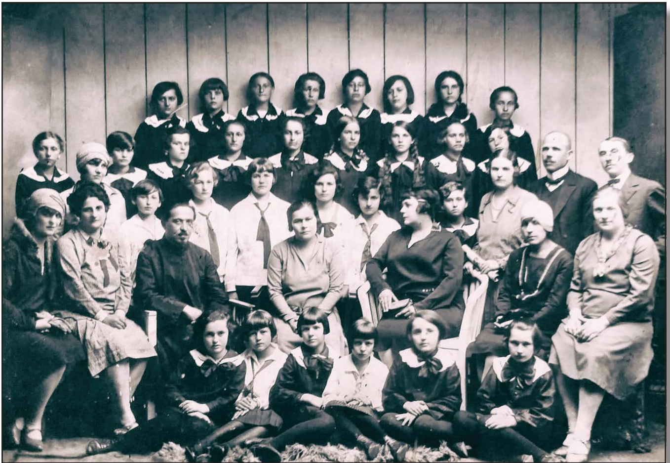
Scoala de fete.