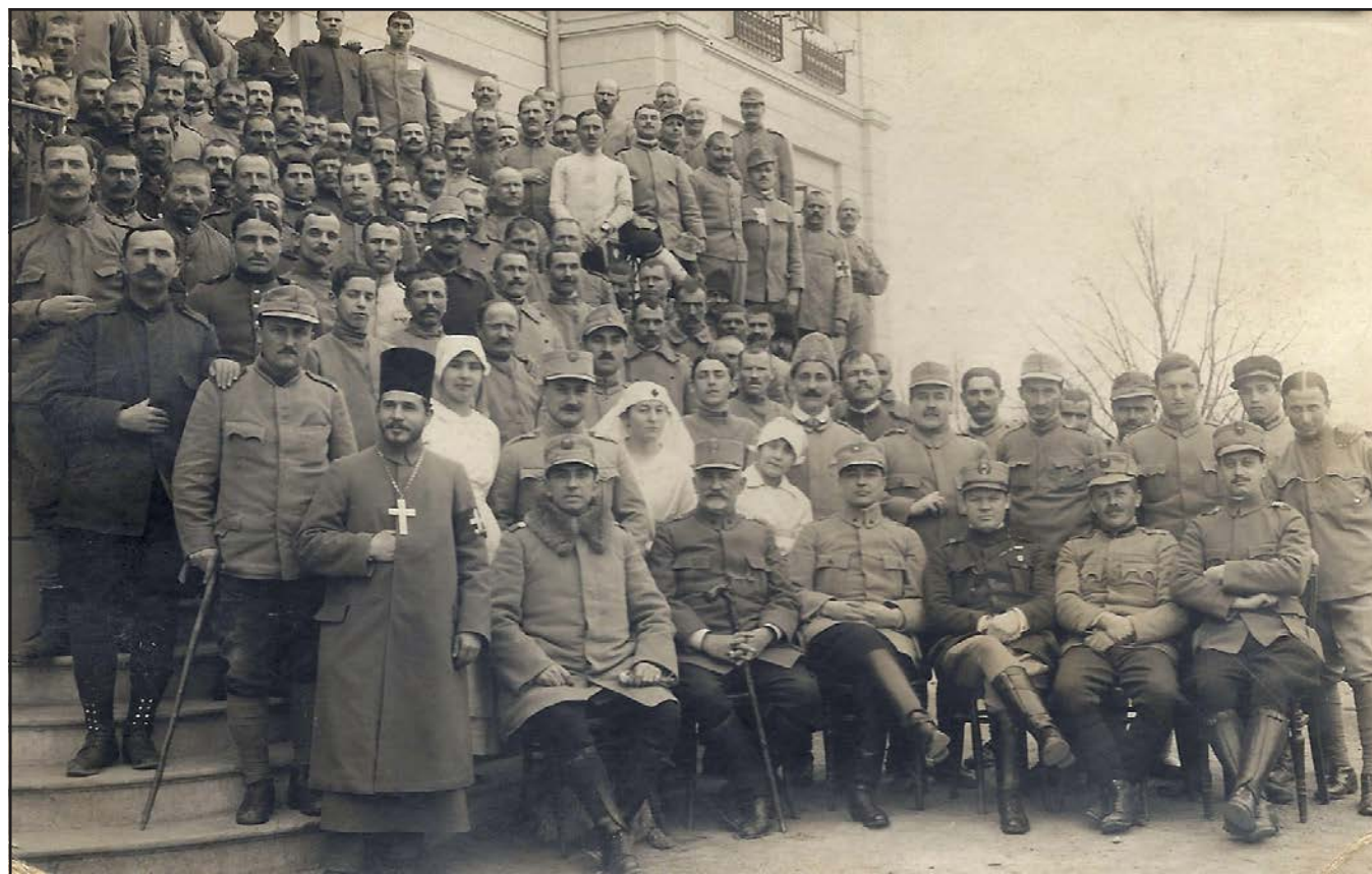
Combatanți români din Primul Război Mondial.

În vara anului 1921, Octavian Goga, în calitate de ministru al Cultelor și Artelor, lansa un „Apel pentru ridicarea unui Monument poetului Mihai Eminescu”, în care se preciza: „Ministerul Cultelor și Artelor a luat hotărârea să ridice în centrul Capitalei un monument nemuritorului nostru poet Mihail Eminescu.