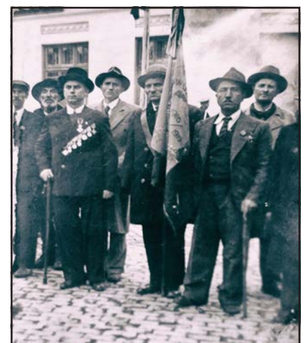
Veterani din Războiul Întregii Naționale 1916-1920