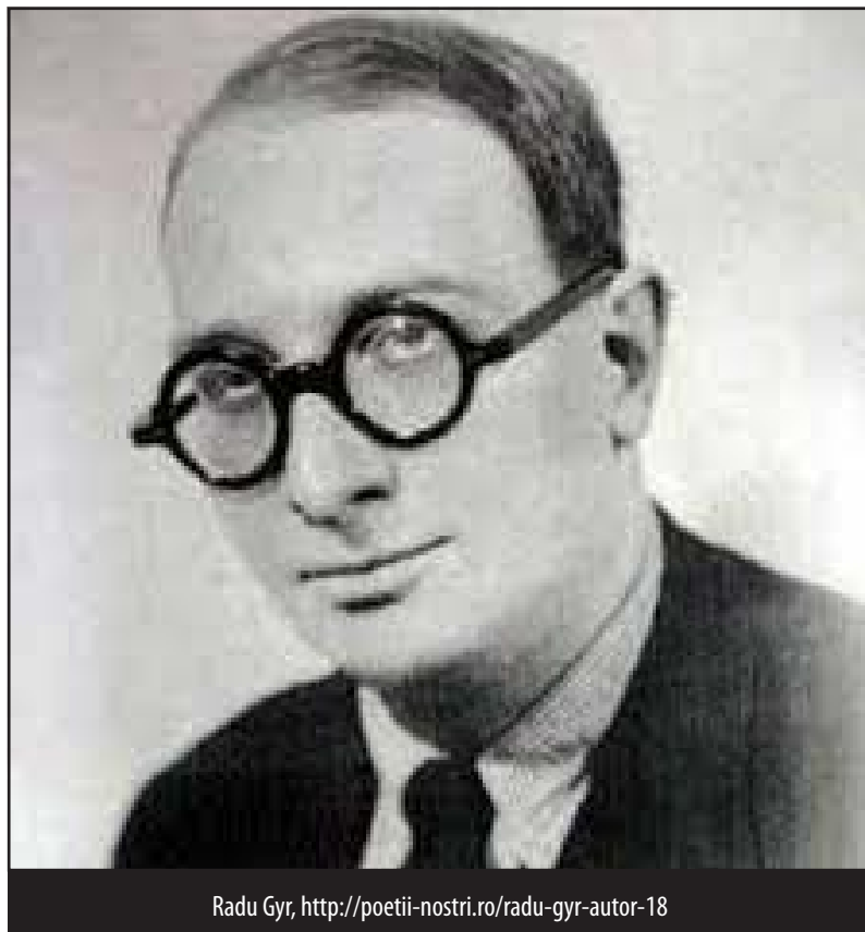
Radu Gyr, http://poetii-nostri.ro/radu-gyr-autor-18