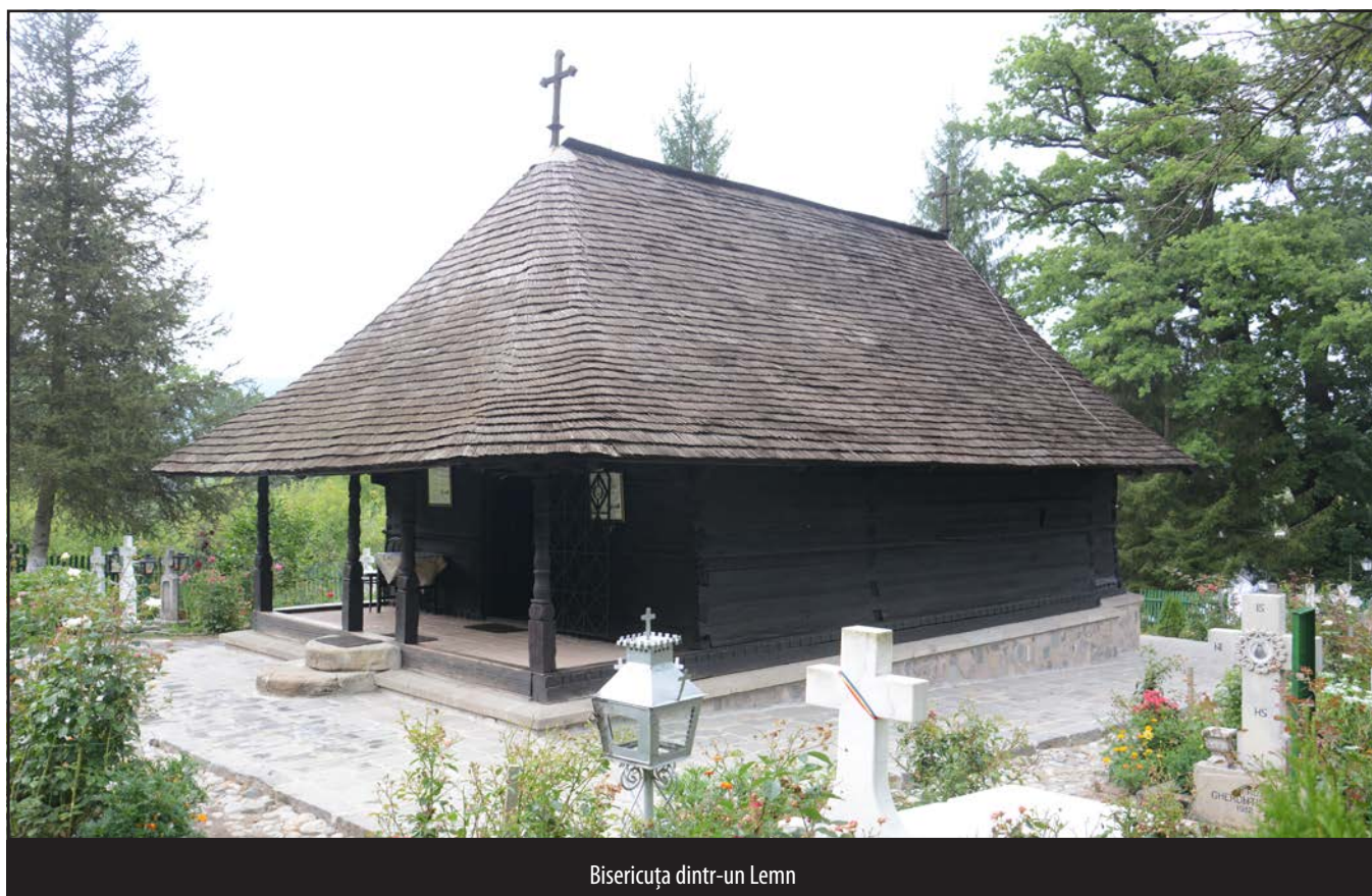
Bisericuța dintr-un Lemn

Radu Socol îi dezvăluie Ancuței, așa cum își imaginează Odobescu, puterea făcătoare de minuni a icoanei găsite în scorbura unui ste- jar și aduse de ciobani tatălui său, icoană, se pare, zugrăvită de însuși Luca Evanghelistul. În acest timp,