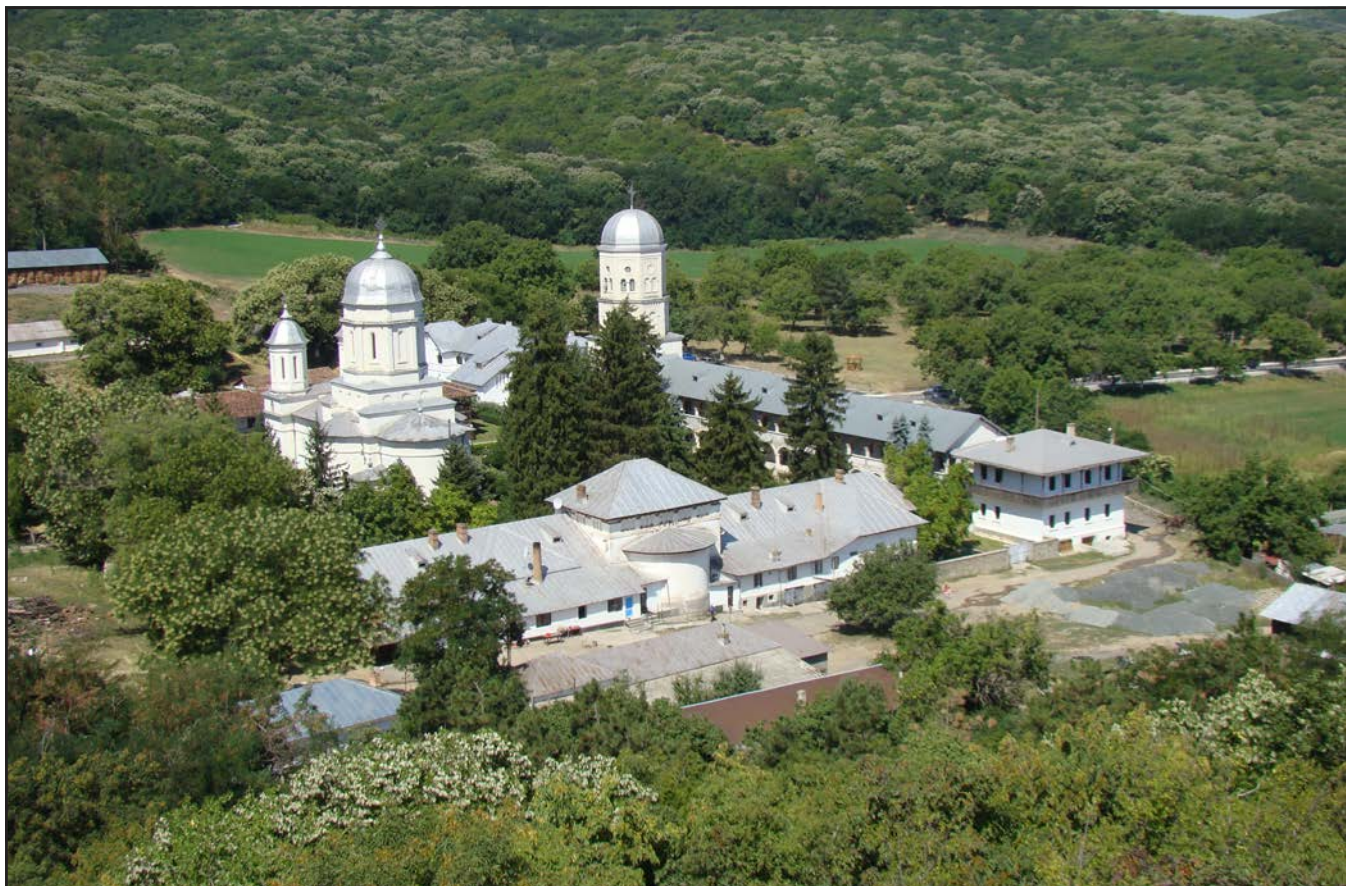
Mănăstirea Cocoș (2013)