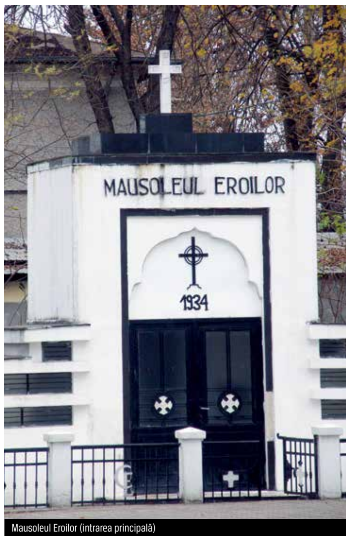
Mausoleul Eroilor (intrarea principală)

Giurgiu, pentru o contribuție lunară, cu o cotă din soldă, până la terminarea construcției. De menționat că unii dintre aceștia nu numai că au contribuit din soldă, dar au și lucrat în mod efectiv, alături de ostași, pe șantier. În ceea ce privește soldații, au constituit întreaga mână de lucru calificată și necalificată. La toate acestea s-a adăugat și o subvenție de 400.000 de lei venită din partea Primăriei orașului Giurgiu.