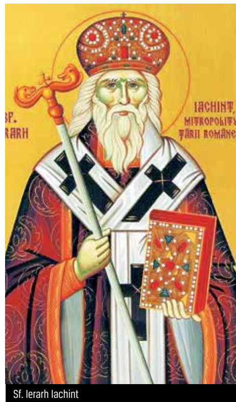
Sf. Ierarh Iachint

Ei să premeargă ca bun exemplu, ca soldatul