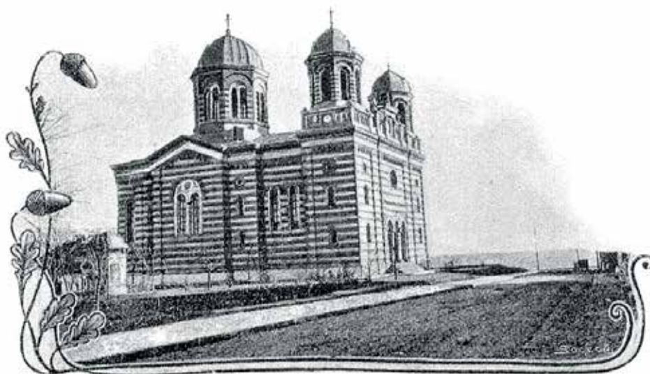
Catedrala Sfinții Petru și Pavel din Constanța, imagine utilizată de autor în volum

Prima lucrare pe care a publicat-o, „fructul a doi ani de muncă”, poartă titlul Cercetări asupra orașului Constanța. Geografie și istorie 8 pe care o „închină lui Grigore Tocilescu, membru al Academiei Române”. Ilustrul savant