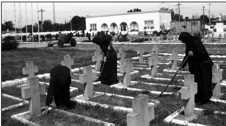
Întreținerea mormintelor eroilor de către maicile mănăstirii de la Mircea Vodă

Înălțarea Domnului; 6 parcele cu 440 de cruci (4 cu 95 de cruci – români, germani, ruși și nemți; 2 cu 30 de cruci – una comună pentru ruși și bulgari și una pentru germani), în dreptul fiecăreia fiind amplasat câte un tun; monumentul central; 4 monumente mici, în dreptul parcelelor mari; schitul pentru călugări.