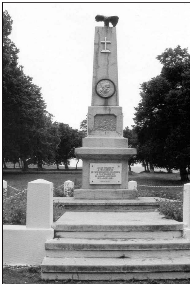
Monumentul Eroilor de la Războieni