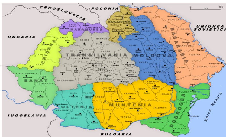
Figura 2. Harta României Mari 1918 7 .