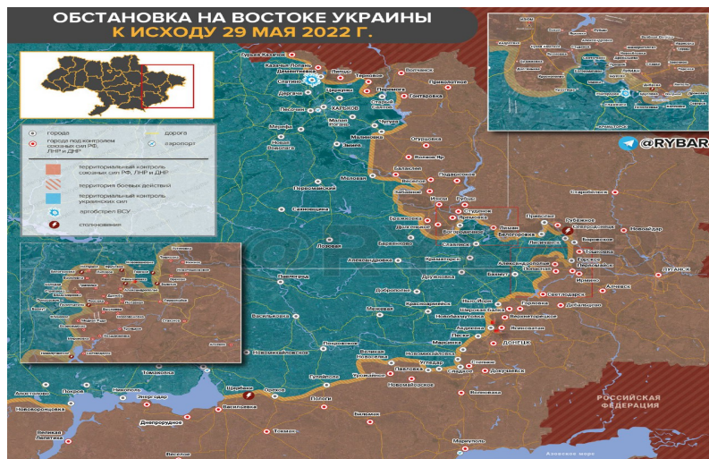
Figura 1. Frontul ruso-ucrainean Lisiceansc-Bahnut-Marianca-Ugledar. Mai 2022.

politicienii și guvernării din ambele tabere. În Rusia și Ucraina mobilizarea a fost forțată, soldații neinstruiți, nepregătiți de război au ajuns carne de tun , sunt lucruri oribile 1