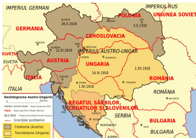
Figura 1. Configurația Imperiului Austro - Ungar și a statelor independente ce aveau să apară 2 .