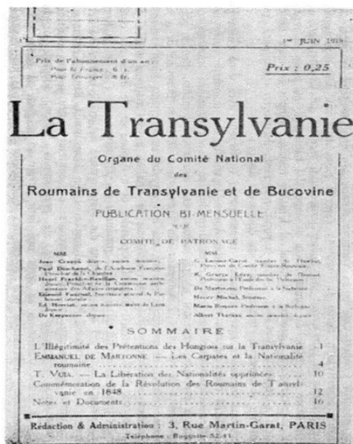
Figura 2. Coperta revistei „La Transylvanie” 18 .