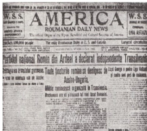
Figura 4. Ziarul românesc din America care a publicat proclamația de independență a Transilvaniei rostită de Vaida Voievod 23 .

În secolul al XXI-lea, numeroase popoare oprite și asuprite din imperiul Austro - Ungar și țării, printre care români, polonezi, sârbi, sârbocroați, italieni, ucraineni, cehi, sloveni etc., își doreau să-și formeze unitatea națională în cadrul unor state naționale proprii. Situația dificilă în care se aflau naționalitățile din cele două imperii avea să se amplifice pe timpul desfășurării Primului Război Mondial, când lupta acestora pentru emancipare națională se va manifesta cu putere.