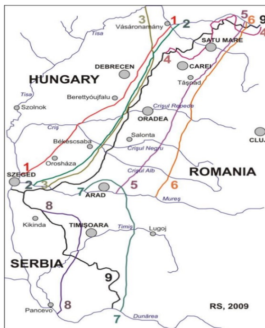
Figura nr.3. Propunerile delimitării teritoriale dintre România și Ungaria (numărul 9 reprezintă granița stabilită la Trianon) 27