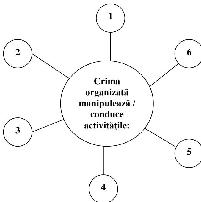
Figura nr. 3. Câteva consecințe ale crimei organizate

oamenii de afaceri se bazează pe sprijinul unui partid politic care ajunge la putere sau pe cel al guvernului. De asemenea, FMI și BM au făcut o estimare greșită a echilibrului între costul economic și cel social al reformei cu efecte dezastruoase asupra politicii bugetare. Cu toate că prin creșterea fiscalității au fost mărite veniturile bugetare, aceasta nu a adus o creștere corespunzătoare a investițiilor, ci doar a consumului social, adică în locul dezvoltării economice au crescut subvențiile și cheltuielile aferente asistenței sociale.