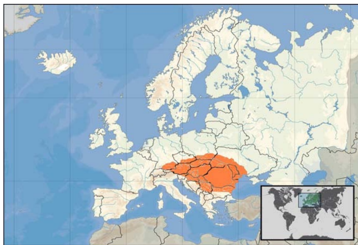
Figura nr. 1. Harta Daciei în anul 44 î. Hr.

Din izvoarele istorice antice care sunt destul de numeroase, rezultă că geto-dacii locuiau pe un teritoriu vast care, în linii principale, se întindea pe Valea Dunării Mijlocii și Carpații Pădurași, la vest, izvoarele și cursul superior al Nistrului, la nord, Bugul și Litoralul Pontului Euxin, la est, iar la sud Dunărea, pe porțiunea de la Bratislava la Porțile de Fier și Munții Haemus (Balcani) care erau, de asemenea, locuiți de geți, ceea ce înseamnă o suprafață de aproximativ 600.000 km 2 (figura nr. 1). Rezultă, așadar, că în hotarele statului geto-dac din perioada la care ne referim erau cuprinse toate pământurile ce aparținuseră geto-dacilor din timpurile care se pierd în negura vremurilor.