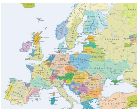
Fig. 2 Harta minorităților naționale europene (sursa: http://www.euminorities.org accesat în data de 23.10.2014)

În opinia personală această criză este generată în primul rând de neomogenitatea națională a Ucrainei. Această lipsă de omogenitate își poate avea originea și în politica internă a Uniunii Sovietice de deportare masivă a populației ucrainene atât înainte cât și după cel de-al doilea război mondial, cu scop de modificare a structurii etnice a populației statului ucrainean ceea ce a dus la situația prezentată în figura 2.