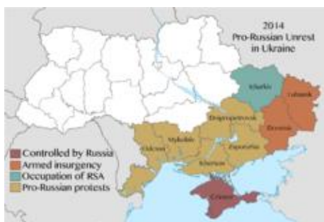
Fig. 1. Ucraina și teritoriile ucrainene aflate în diferite stadii de criză și conflict (sursa: http://ro.wikipedia.org/wiki/Interven%C8%9Bia_armat%C4%83_rus%C4%83_%C3%AEn_Ucraina_din_2014 Intervenția armată rusă în Ucraina din 2014accesat în data de 15.10.2014)

regiunea Donbas insurgenți separatiști rusofoni 7 ajutați de trupe și vehicule militare blindate, fără însemne, au deschis un nou front de luptă pe coasta Mării Azov.