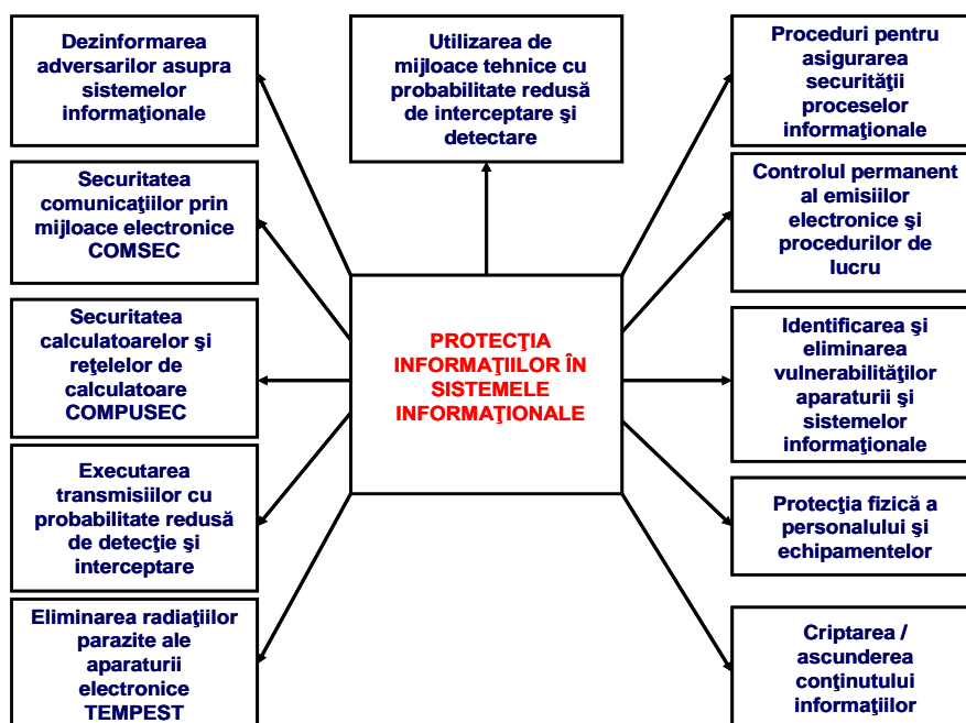
Fig. 1. Principalele măsuri de protecție a informațiilor în sistemele informaționale

În general 14 , amenințările privind securitatea sistemelor informaționale și a informațiilor vehiculate prin acestea pot fi grupate astfel: