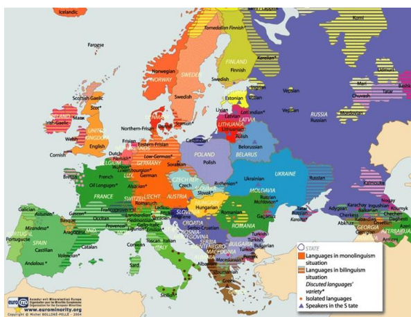
Fig. 3 Harta limbilor vorbite in Europa (sursa: http://www.euminorities.org accesat în data de 23.10.2014)

Unitatea națiunii nu este menținută numai de etnie ci și de limba vorbită. Sentimentul de apartenență națională trebuie să fie simțit dar și exprimat. Din acest punct de vedere situația din Ucraina se prezintă conform figurii 3.