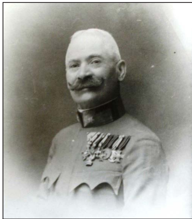
Generalul Dionisie Florianu (ACL)

Pe plan cultural a fost un bun propovăduitor al ideilor ASTREI, fiind membru ordinar al acestei instituții culturale încă de la înființarea sa 4 .