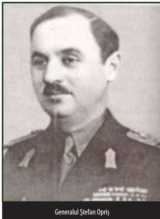
Generalul Ștefan Opreș