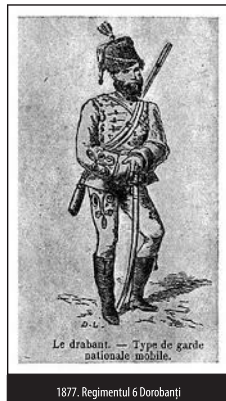
1877. Regimentul 6 Dorobanți

În primele luni de război e împărțit prin redutele și paralele de la Grivița, unde suferă simțitoare pierderi de oameni. La 17 octombrie 1877 ia parte la atacul Vidinului, iar în ziua de 7 noiembrie 1877 la atacul