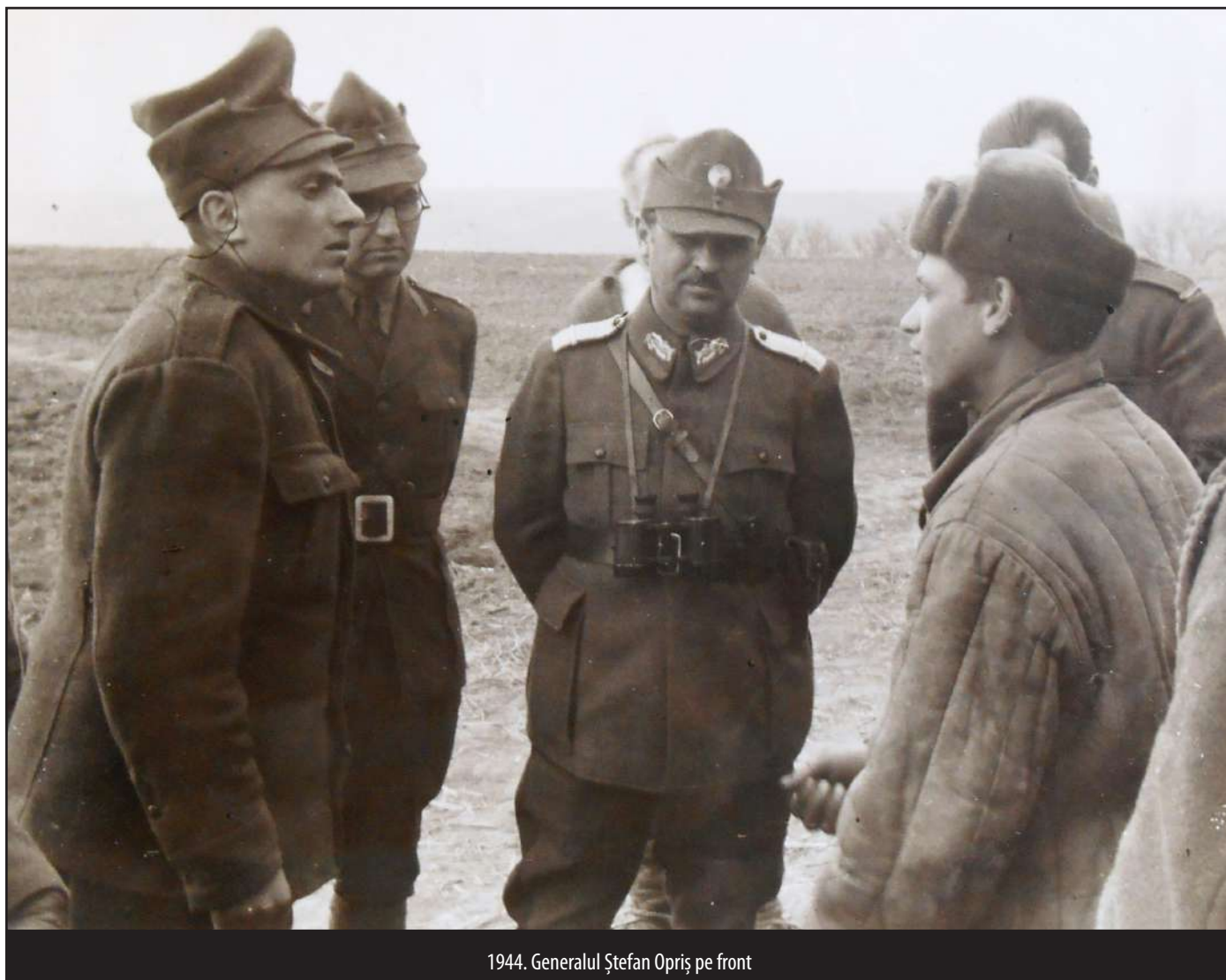
1944. Generalul Ștefan Opriș pe front

La 1 februarie 1949 Regimentul de Gardă „Mihai Viteazul” s-a transformat în Regimentul 6 Infanterie, iar după un an și jumătate (1 decembrie 1950) a devenit Regimentul 148 Infanterie.