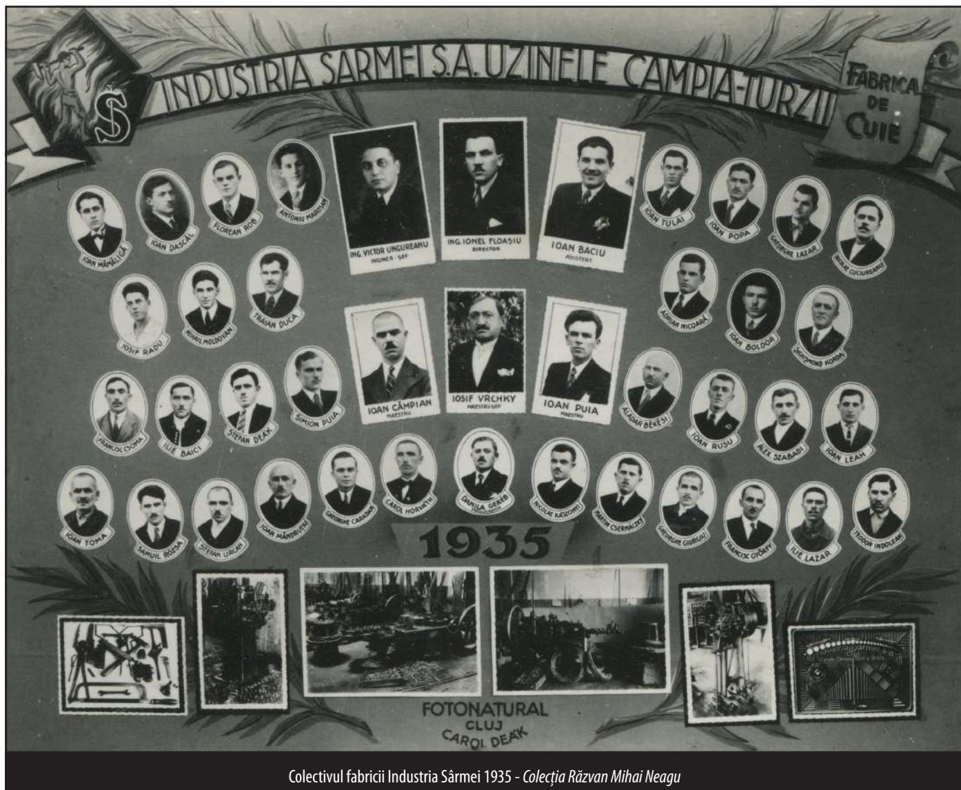
Colectivul fabricii Industria Sârmei 1935