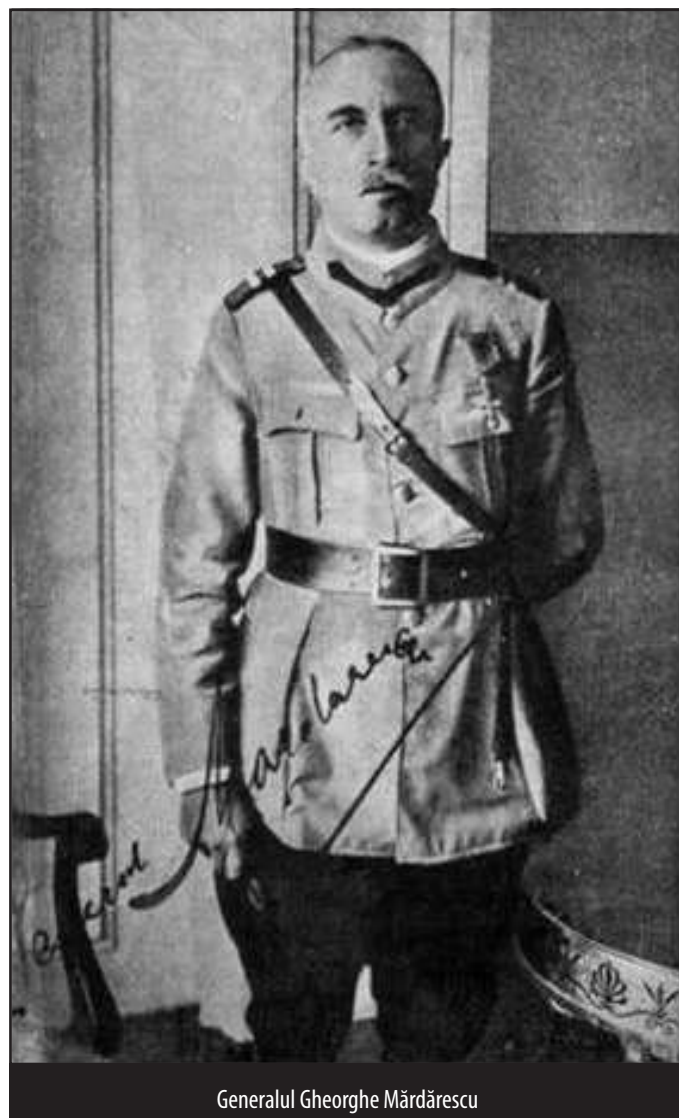
Generalul Gheorghe Mărdărescu

În ziua de 25 iulie, referitor la acesta, ofițerul român de legătură pe lângă M.C.G. cehoslovac a transmis o informare M.C.G. român arătând că „Masaryk 19 , președintele Republicii, a ordonat generalului Pellé 20 , în această zi, să facă, în cea mai mare tăcere, toate pregătirile pentru o ofensivă contra Ungurilor, având intenția să înceapă această ofensivă, chiar dacă Consiliul celor 4 n-ar aproba-o și că, în acest scop, în seara de 26 iulie va pleca spre București colonelul Husak, șeful Cabinetului Militar al președintelui Republicii, și căpitanul francez