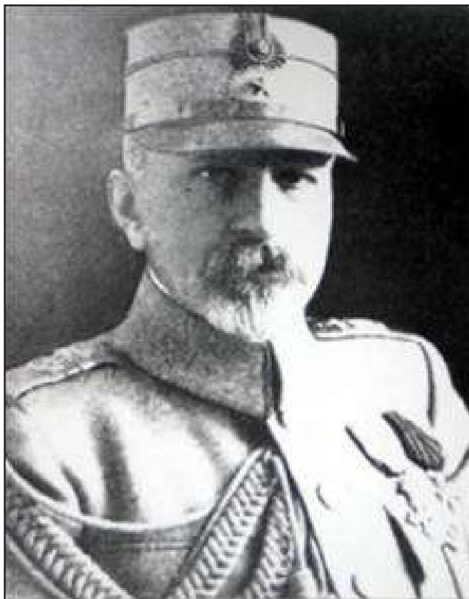
Generalul Constantin Prezan