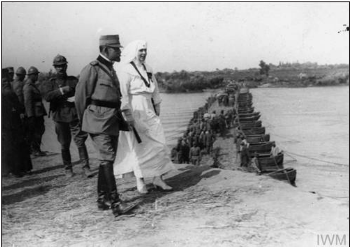
Regele Ferdinand și Regina Maria, la podul de la Tisabö

Divizia 7 Infanterie, după trecerea Tisei, trebuia să se concentreze până în seara de 31 iulie în zona Heves