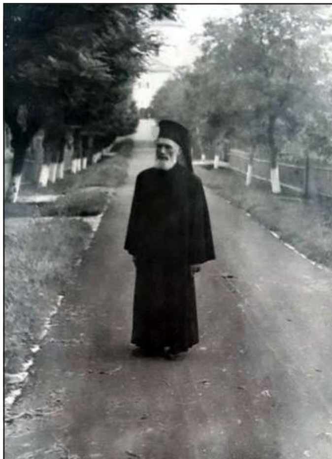
Arhimandritul Vladimir Muscă

Născut în anul 1874 în comuna Boroaia, jud. Suceava, în anul 1906, luându-și crucea, a urmat lui Hristos, făcându-se călugăr în Mănăstirea Neamț.