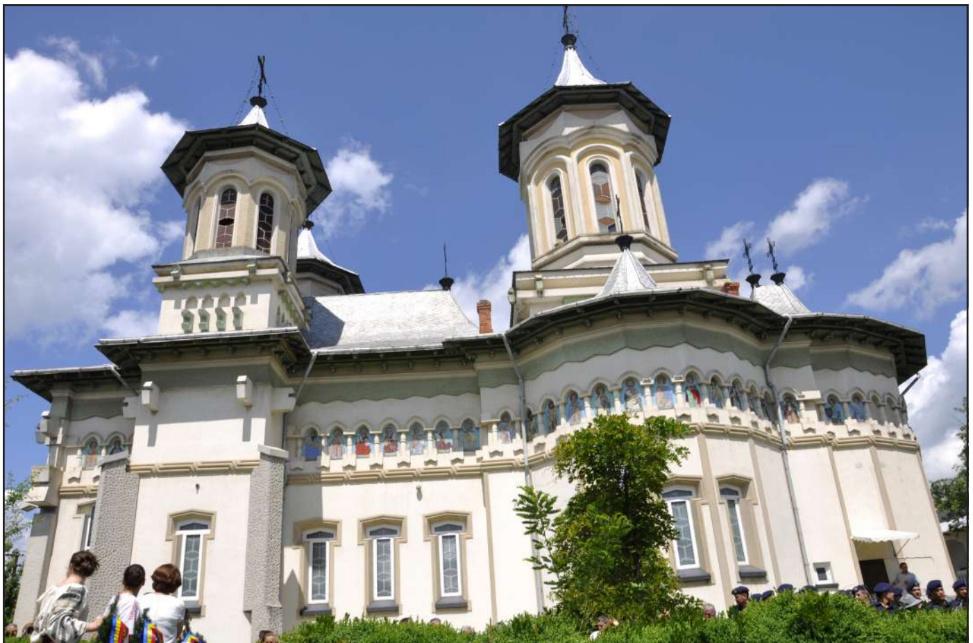
Biserica din centrul comunei Boroaia, ctitorită de părintele Ioan Argatu

În urma decesului soției sale, în ianuarie 1973, părințele Argatu se retrage la Mănăstirea Antim din București, unde se călugărește cu numele Ilarion.