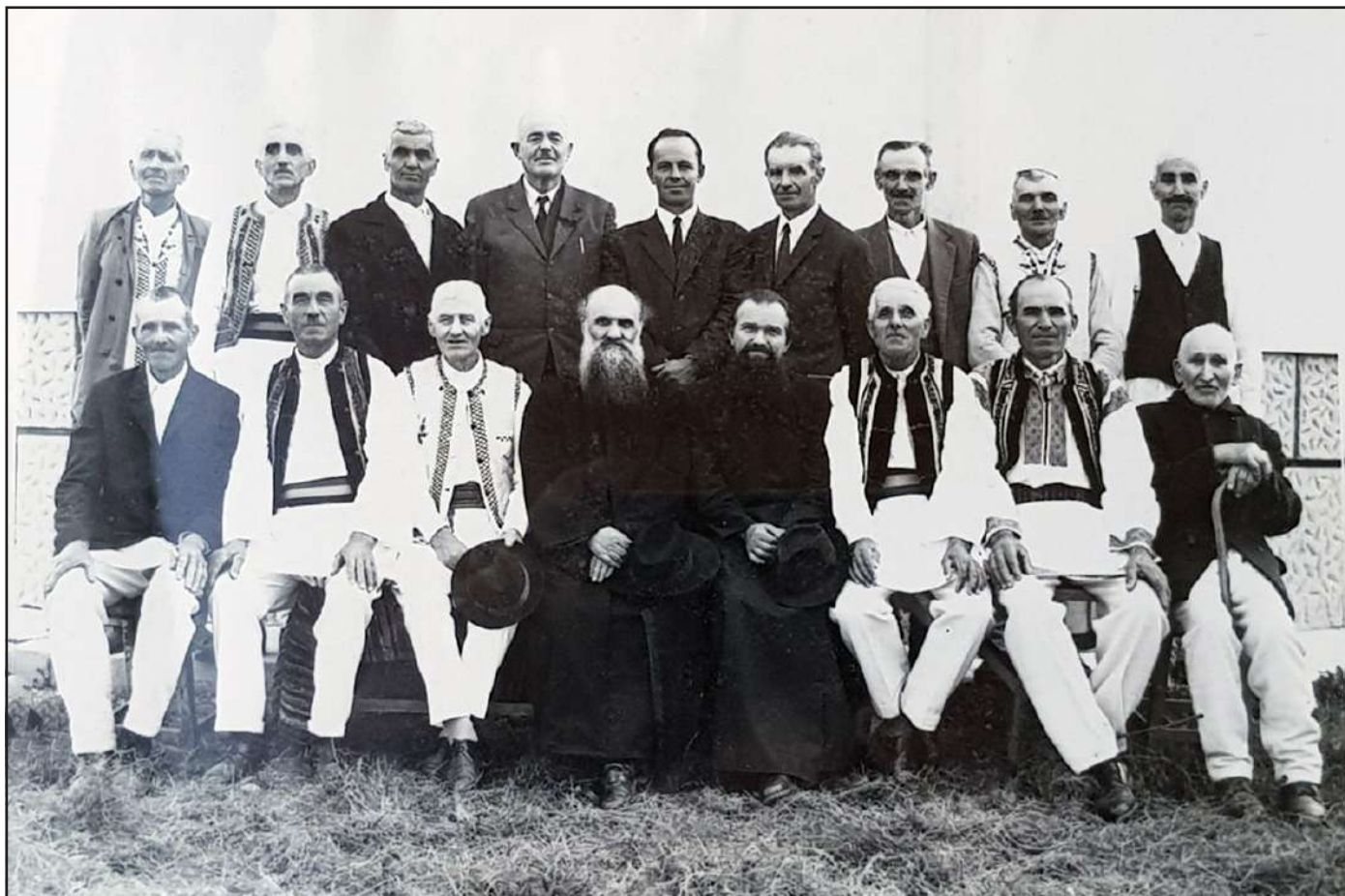
Consiliul parohial al Bisericii din Boroaia 1972