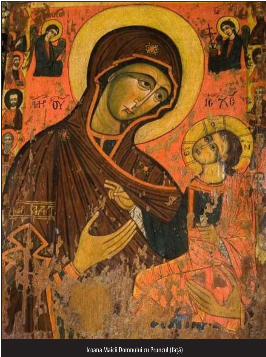
Icoana Maicii Domnului cu Pruncul (față)

reparațiilor din anii 1955-1956 s-a intervenit la soclu, unde erau degradări, la acoperiș, console și grinzi. S-a pus șindrila în trei straturi.