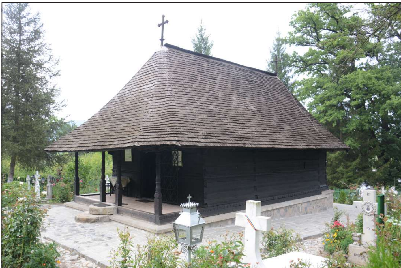
Bisericuța dintr-un lemn (exterior)

conexeze la spiritualitatea ortodoxă ce o degajă Sfântul lăcaș. Un trecut secular ce a împletit legenda cu adevărul istoric, sintetizat cum nu se putea mai reușit în numele unic ce-l poartă complexul monahal – Mănăstirea Dintr-un Lemn.