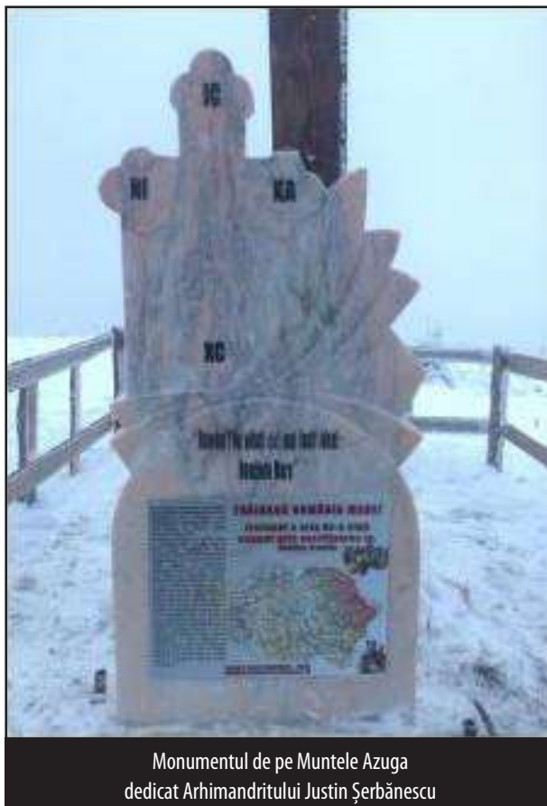
Monumentul de pe Muntele Azuga dedicat Arhimandritului Justin Șerbănescu