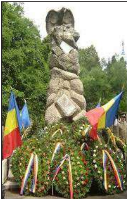
Monumentul eroilor Diviziei 2 Vânători de la Oradea

cu care a fost organizat un parastas, la care au participat oficialități civile și militare din județul Făgăraș.