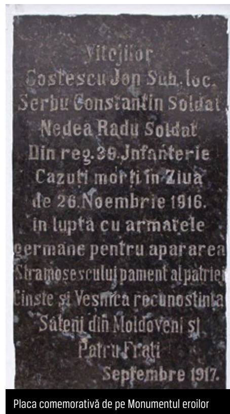
Placa comemorativă de pe Monumentul eroilor