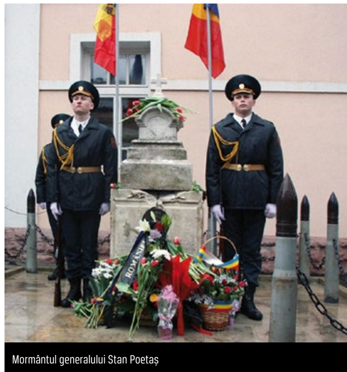
Mormântul generalului Stan Poetaș

Keywords: Stan Poetaș, Nistru, Bolsheviks, assassination, Soroca, national funerals.