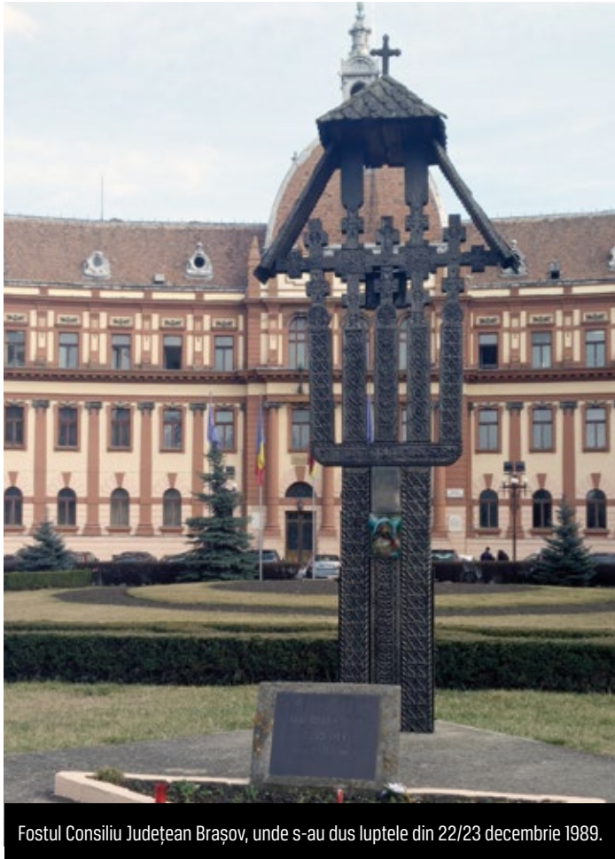
Fostul Consiliu Județean Brașov, unde s-au dus luptele din 22/23 decembrie 1989.