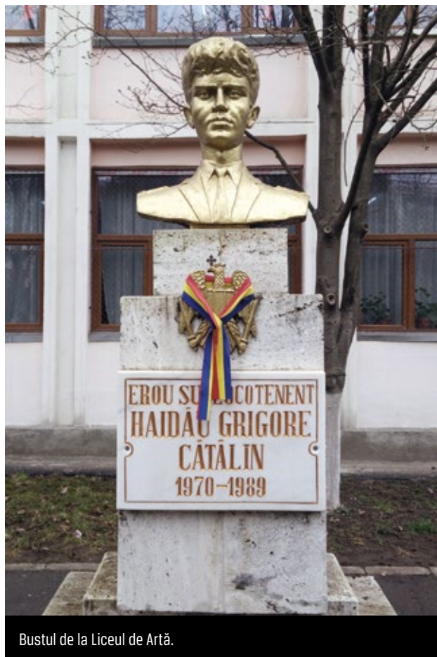
Bustul de la Liceul de Artă.

Acum, după atâta vreme, răsfoind file îngălbenite, îmi revin amintirile, trăirile pe care am dorit să le îngrop adânc în memorie, dar care nici măcar nu s-au estompat. Feciorul meu cel mic, la cei 14 ani ai lui, vârsta la care majoritatea dintre noi, foștii colegi din școala militară de la Brașov, ne începeam acum 30 de ani, în 12 septembrie 1984, viața de ostași, ca elevi ai liceelor militare, a descoperit, în pod, o