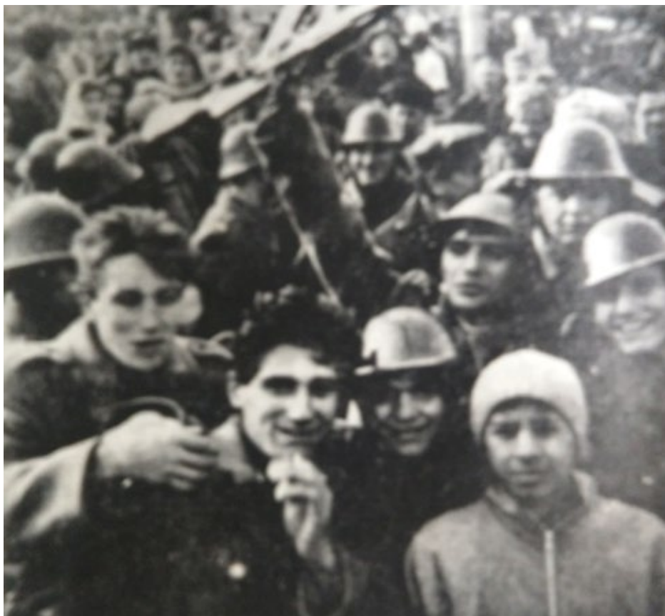
O fotografie cu colegii în misiunea din oraș desfășurată în data de 21 decembrie 1989.

„Am mai spus-o și cu altă ocazie, zeii iau jertfă pe cei mai buni. Așa a fost și în cazul de față. Calitățile și virtuțile pe care i le recunosc colegii, în portretele care urmează, nu sunt de circumstanță, convenționale, ci reflectă o realitate individuală, o puternică personalitate în formare, un tânăr de perspectivă, un suflet delicat. Colegii l-au apreciat, îi căutau