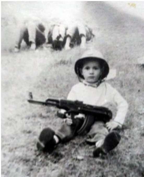
La numai trei ani, după un ceremonial militar, un soldat l-a echipat pentru o fotografie, aproape premonitorie: așa a plecat în eternitate.

acestora este completată cu impresii și amintiri proprii atât despre sacrificiul vieții eroului cât și aprecieri privind personalitatea acestuia.