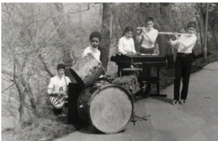
În formația de muzică de la Școala Generală.

Completez mărturiile colegilor mei, așa cum am precizat de la început, cu propriile mele trăiri: