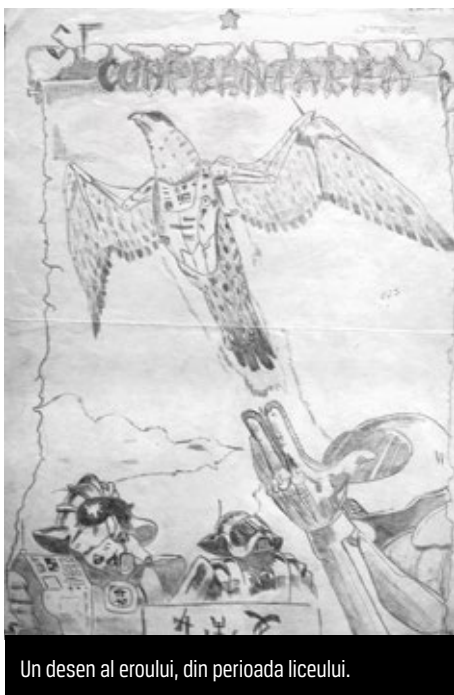
Un desen al eroului, din perioada liceului.