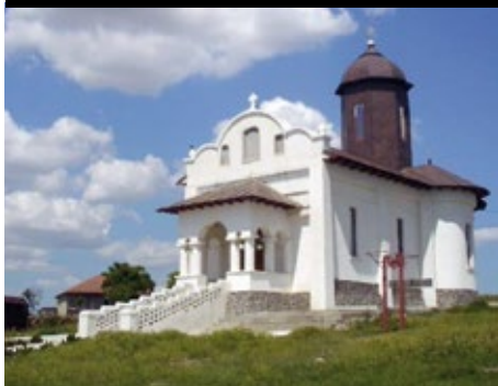
Biserica din Stejaru