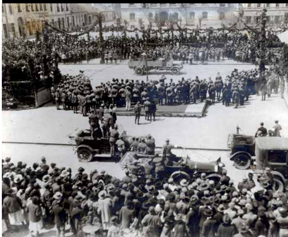
Populația din Oradea Mare asistând la parada trupelor române, 23 mai 1919

Keywords: Romanian Army, national unity, ideals, sacrifices, certitudes for posterity