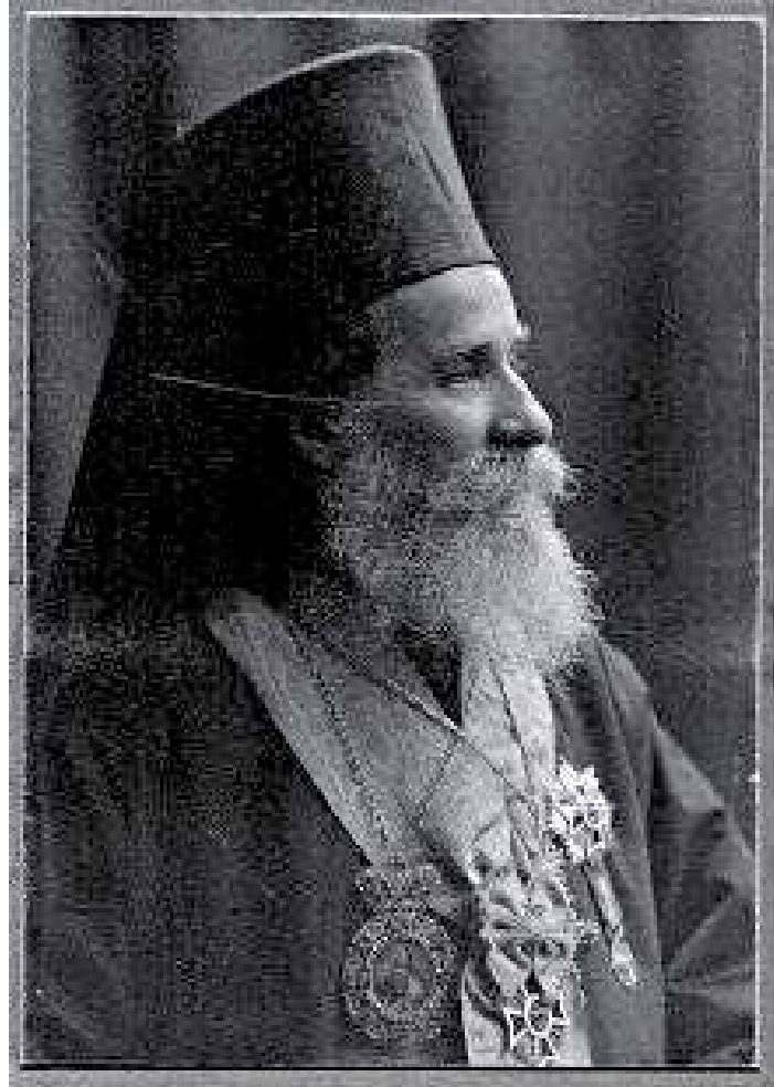
Mitropolitul Pimen Georgescu în anul 1912

Cu totul semnificativă - chiar simbolică, ne apare astăzi - vizita pastorală a mitropolitului Pimen în satul Mamornița, la bisericuța din lemn a satului. În scurta cuvântare rostită cu acest prilej, ierarhul a spus: „Știu că sunteți expuși la cele mai mari primejdii ale vieții și la cele mai adânci dureri ale sufletului pentru jertfele ce se fac din cei de un neam și de o lege cu noi [...]. Bubuitul tunului, care-l auziți așa des, să nu vă înfricoșeze. Căci Dumnezeu e cu noi și cu ajutorul Lui vom