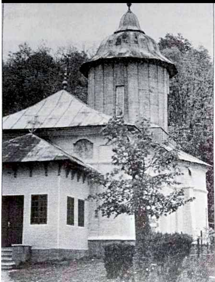
Biserica din Provița de Sus, înălțată în 1629, unde a fost botezat pruncul Petre în anul 1853, viitorul Mitropolit Pimen Georgescu al Moldovei și Sucevei

politului Moldovei și Sucevei Partenie Stancu-Clinceni, apoi vacantarea scaunului de mitropolit primat al Regatului României, prin trecerea la cele veșnice a mitropolitului primat Iosif Gheorghian, în noaptea de 23/24 ianuarie 1909 24 .