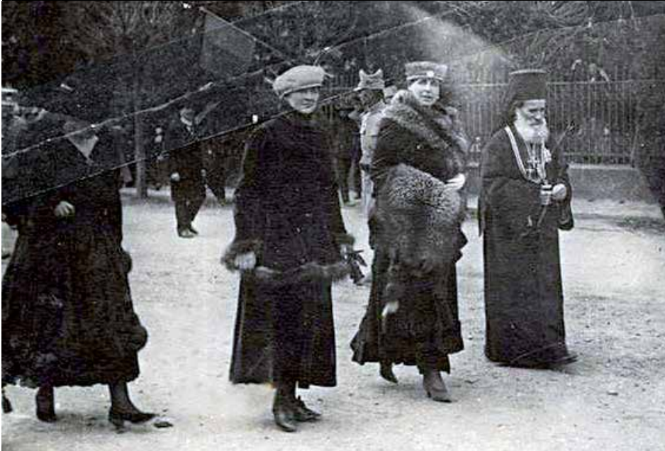
Regina Maria și Mitropolitul Pimen Georgescu

Pe toată durata campaniilor din anii 1916-1918, mitropolitul Pimen Georgescu se va adresa prin mai multe Scrisori pastorale preoților din subordinea sa, îmbărbătându-i și îndemnându-i la săvârșirea datoriei lor, ca adevărați apostoli întru Mântuitorul Iisus Hristos 46 .