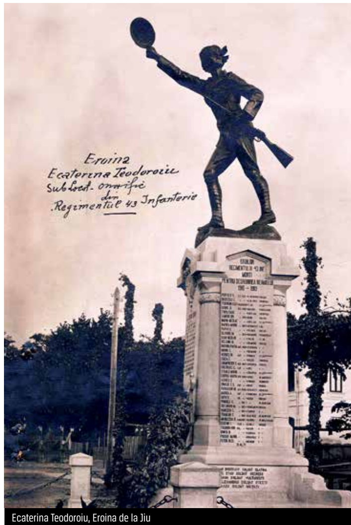
Ecaterina Teodoroiu, Eroina de la Jiu

te șovăind, întreținându-se cu fiecare din noi. Caută cu ochii săi negri să ne cuprinză și să ne citească în suflete spre a întrevădea ce simțim. Deși tânără, totuși se vede că avea suflet mare; privește drept înainte și pare a spune: «- Deși sunt femeie, am luptat și mi-am vărsat sângele pentru apărarea Patriei. Sângele meu care a curs să vă fie imbold în viitor». O vedem cu toții: pe piept îi sclipește «Virtutea Militară» 5 .