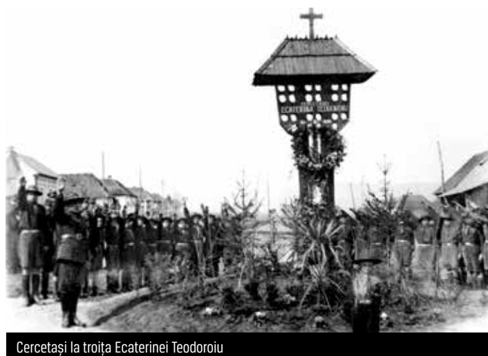
Cercetași la troița Ecaterinei Teodoroiu

Ecaterina Teodoriu în ziua când am venit la Poienile Popii cu brigada, făcând un drum extraordinar de greu pe o ploaie torențială care a durat de cu noapte până la ajungere la destinație. Avea cu ea arma și un sac de pesmeți atârnat de gât. Întrebând-o ce face, mi-a răspuns cu veselia ei obișnuită că luptă cu greu și nu se simte biruită; arătându-mi sacul era plin de cartușe. Mi-a spus apoi că ține cu orice preț a lua parte la aceste prime lupte ca să nu zică soldații că până acum i-a îndemnat să fie viteji și tocmai când trebuie să le dea și exemplul de vitejie ea să dispară din mijlocul lor, trecând la un serviciu înapoia frontului. După ce va obține o biruință cu plutonul ei va trece la Crucea Roșie 20 .