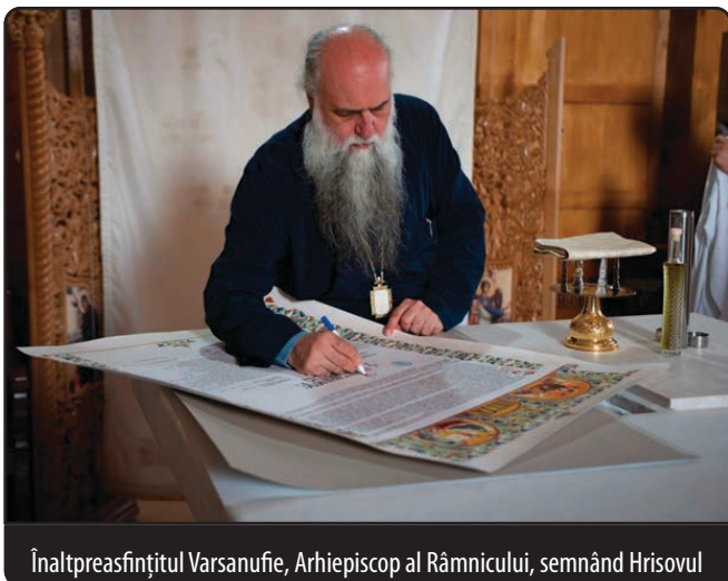
Înaltpreasfințitul Varsanufie, Arhiepiscop al Râmnicului, semnând Hrisovul

Înainte de Sfânta Liturghie s-a semnat, în Sfântul Altar, Hrisovul, un document impresionant în care textul este încadrat într-un model deosebit și anume: în registrul de sus partea stângă este reprezentată