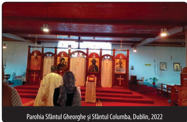
Parohia Sfântul Gheorghe și Sfântul Columba, Dublin, 2022

civil irlandez pentru cooperarea dintre diferitele biserici creștine din Irlanda) remarcă generozitatea părintelui și contribuția sa la binele comunității ecumenice din Irlanda. A fost vice-președintele Consiliului irlandez al bisericilor în perioada 2010-2012 și președinte în anii 2012-2014, reprezentând totodată Biserica ortodoxă română. 18