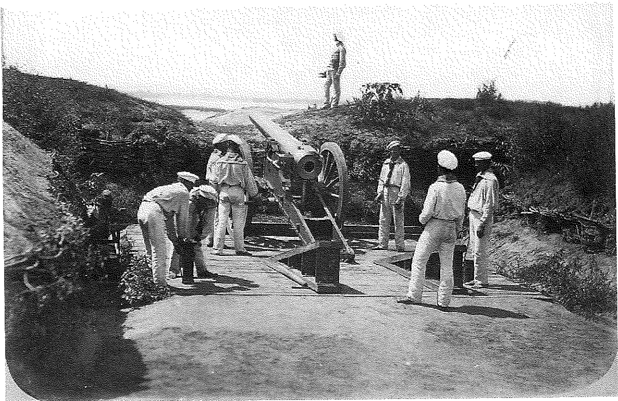
Bateria Mircea la Calafat, 1877

Congresul de la Paris - participanții care au decis înființarea Comisiei Europene a Dunării