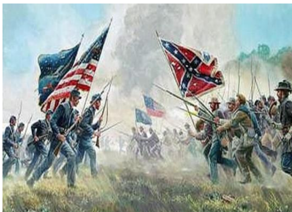
Figura 1. Războiul Civil American 8

După prima bătălie de la Bull, statul Virginia, Uniunii, care au avut pierderi mari, au fost constrânși să cheme sub arme mai mulți voluntari cerând statelor din Nord să formeze noi regimente.