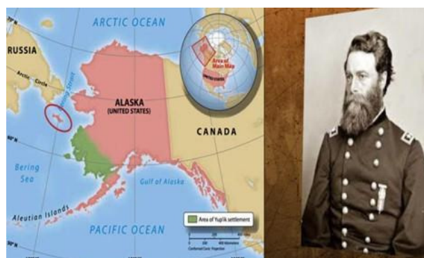
Figura 3. Alaska proprietatea SUA 22

În calitate de consul, a avut meritul de a participa la negocierile pentru cumpărarea peninsulei Alaska (figura 3) de către Statele Unite ale Americii, de la ruși 21 .