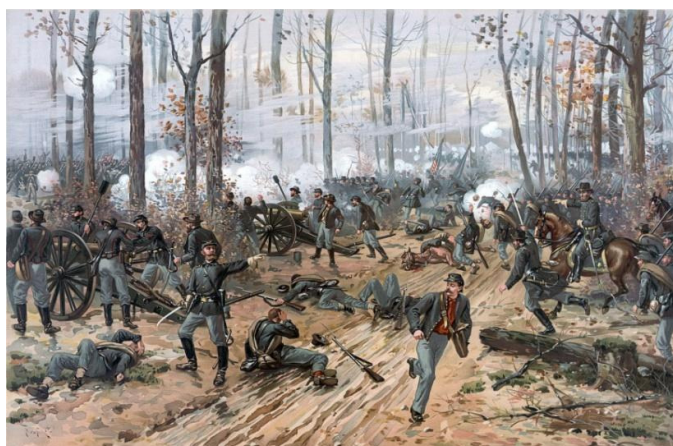
Figura 2. Bătălia de la Sihloh 11

În această bătălie avea să fie rănit, dar a continuat lupta „a ignorat rana ... și nu s-a dat jos de pe cal până nu a căzut slăbit de puteri” 12 . Va fi evacuat, dar nu va avea răbdarea să stea în spital, iar după câteva zile, se va întoarce la regiment, care era în refacere în aceeași zonă.