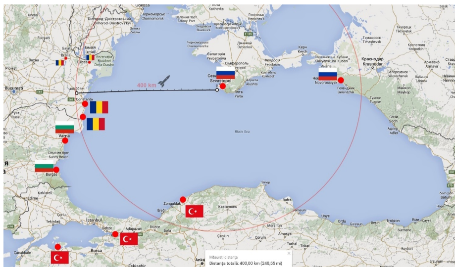
Figura 1. Harta bazelor militare în Marea Neagră și raza medie de 400 de km pornind din Crimeea unde Rusia a staționat numeroase sisteme de armament 4

Pentru prevenirea și combaterea atacurilor aeriene este necesară o apărare complexă și puternică: aviație de vânătoare, artilerie, rachete, radiolocație, precum și spionaj. Pentru eficiența maximă acestea se concentrează în baze AA, însă inconvenientul este că acestea se protejează pe ele (dacă sunt capabile) și zona învecinată, iar inamicul le poate ocoli. Rusia are asemenea superbaze AA ( bule de protecție ) pentru capitală la Moscova, pentru bazele aero-navale pe granița de vest (Sankt Petersburg și Kaliningrad, pe granița de sud (Crimeea - figura 1 ), pe granița de est (Vladivostok), pe granița de nord (Murmansk) și, probabil, vor mai fi și altele.