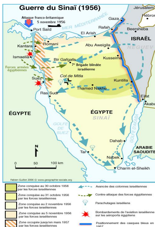
Figura 2. Războiul din Sinai (1956) 6

Rusia sovietică își dorea să sfâșie Imperiul Britanic în bucăți și, drept urmare, credea în șansa sa de a sări peste parteneriatul nordic și a crea un sistem propriu de state protejate. Ea s-a oferit să sprijine coaliția anti-israeliană a președintelui egiptean Gamal Abdel Nasser, cu o cantitate uriașă de arme din spatele Cortinei de Fier, furnizate pe credit 7 , și, de asemenea, să construiască barajul de pe Nil.