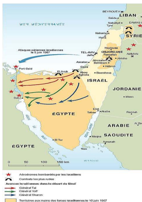
Figura 3. Cucerirea țărmului asiatic al Sinaiului 27

cădea în mâinile lor 25 . Între timp, forțele israeliene vor cuceri Cisiordania. La 8 iunie, mii de refugiați palestinieni vor tece granița în estul Iordaniei, în vreme ce israelienii vor deveni stăpâni pe întreaga Iudee și pe Samaria. 26