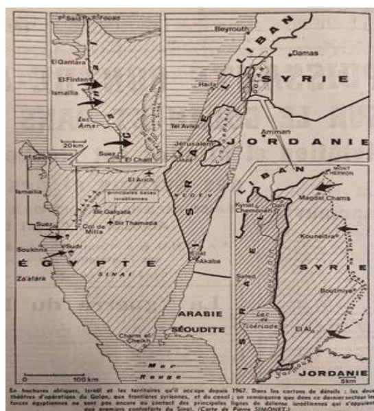
Figura 4. Războiul Yom Kippur: hartă publicată în Le Figaro la 8 octombrie 1973. În hașurile oblice Israelul și teritoriile pe care le-a ocupat din 1967. În casetele de detalii: cele două teatre de operații din Golan, la granițele siriene și la canalul din Suez 30 .

Războiul a izbucnit de ziua de sâmbătă 6 octombrie 1973, în timpul festivalului Yom Kippur (Ziua Împăcării, cea mai importantă zi din calendarul evreiesc), printr-un atac surpriză* conjugat egipteano - sirian,