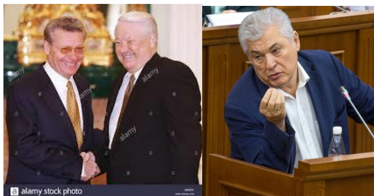
Politicienii moldoveni, deputații P. Lucinschi, Vl. Voronin, mai târziu președinți ai Republicii Moldova, au acționat împotriva intereselor naționale, au avut acțiuni subversive și de colaborare cu structurile politice și militare ale Federației Ruse în toată perioada războiului, 1992.

Decizia a venit ca un cutremur, ca un trăsnet, ruinând total buna încredere a ostașilor în loialitatea conducătorilor de vârf. Militarii și voluntarii știau că Limba