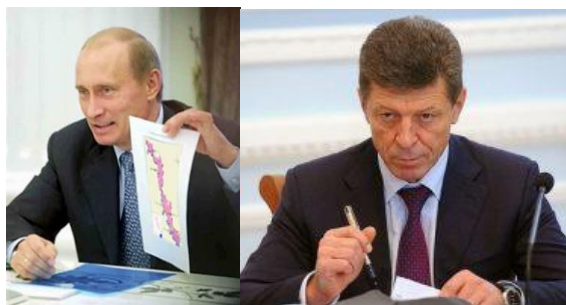
Pentru a controla mai bine Republica Moldova, președintele Rusiei, Vladimir Putin, propune federalizarea, 2018.

Putin și Kozak, pentru a transforma Republica Moldova într-o gubernie rusă, propun lui Dodon(ov) Federalizarea republicii și integrarea cu Rusia.