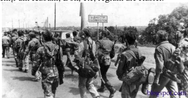
Armata a 14-a rusă și forțele separatist de la Tiraspol invadează, la 19-20 iunie 1992, teritoriul Tighinei, pământ al Țării Moldovei.

organizat posturi de control și apărare împotriva incursiunilor separatiste și a omuleșilor în uniforme verzi (militari fără însemne din armata rusă), precum și a cazacilor ruși veniți din Kubani, Don, etc, regiuni ale Rusiei.