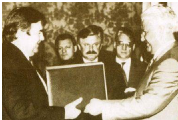
Satisfacție și zâmbete la Moscova, unde s-a semnat rușinoasa Convenție de încetare a războiului (conflictului armat), președinții B. Elțin, M. Snegur, în centru generalul Al.Ruțcoi, 21 iulie 1992.

din partea dreaptă a Nistrului, separatiștilor tiraspoleni, care înființaseră un stat nelegitim pe partea stângă a Nistrului? Cu siguranță, nu!