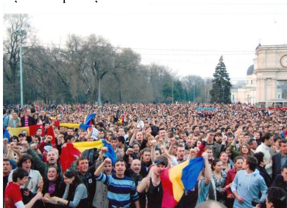
Manifestările populației românești din Moldova împotriva Federalizării și sărăciei, Chișinău, 2009.

Criza economică și socială prezentă în societatea basarabească va exista până când nu va fi remodelată mentalitatea clasei politice și a acelor persoane ce guvernează țara. Nici un miracol nu va putea salva situația critică a acestui stat și popor dacă la putere vor exista oameni și funcționari publici cu o mentalitate coruptă, necinstită și incompetentă.