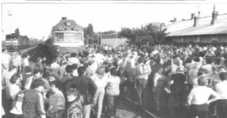
Manifestări ale femeilor rusofone la gările din Tiraspol și Tighina, împotriva deciziei de folosire a limbii române ca limbă de stat, august 1990, 1991.

Un mare rol în pregătirea și declanșarea războiului împotriva Republicii Moldovei l-au jucat mass-media aservită rusiei (posturile de radio, ziarele, televiziunile), care, la unison au încurajat și îndreptățit agresiunea. Dezinformarea populației prin mass-media este de asemenea un element al războiului hibrid.