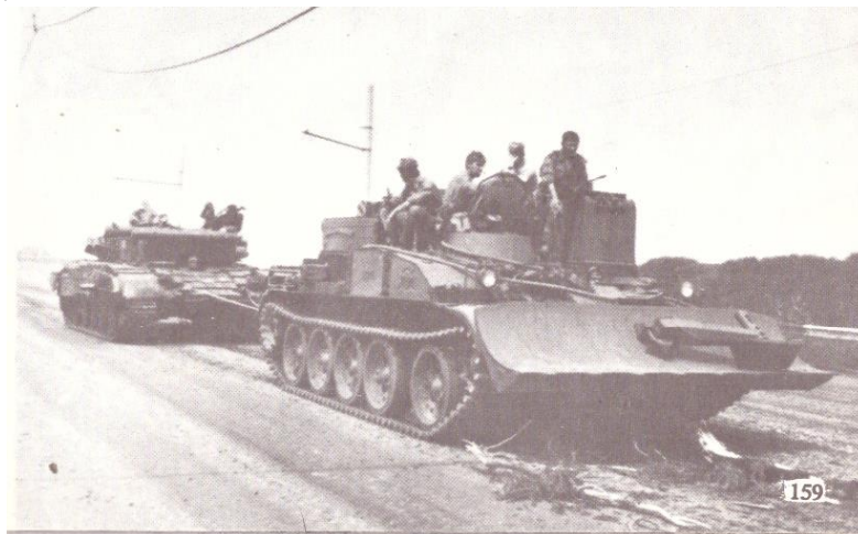
Tancuri al armatei a 14-a ruse distruse, avariate în luptă de tunurile antitanc ale moldovenilor, tractate la baza din Tiraspol, 23 iunie 1992.

Cadrele de comandă, ostașii noștri, dând dovadă de eroism și devotament față de tânărul stat suveran Republica Moldova, au luptat pe viață și pe moarte, cu separatiștii transnistreni, cu tancurile și blindatele Armatei a 14-a ruse, dar nu au reușit singuri să doboare această hidră imperialistă. Unii au pus accent pe pace, pe luptă diplomatică, pe instituțiile internaționale, dar nici aici nu s-a reușit, sau poate nu s-a dorit.