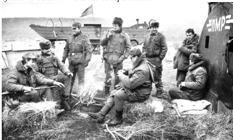
Structuri paramilitare ruse, instalate în Transnistria și Găgăuzia la intrările în localități, 1991.

La 2 martie 1992, forțele armate ruse au deschis foc asupra populației pașnice la Cocieri – sat moldovenesc, unde au omorât civili pașnici, neînarmați. Cazacii ruși au violat femei și copii minori, omorându-i cu bestialitate. Astfel, a început oficial războiul în Transnistria separatistă.