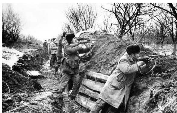
Voluntarii moldoveni își apără independența și pământul strămosesc, martie 1992.

Acest fapt a fost confirmat prin documente, rapoarte ale serviciilor de contrainformații moldovenești, dar și de oficialitățile rusești de la Moscova, care au comunicat deschis faptul că prin război se va împiedica reunirea Moldovei cu România.