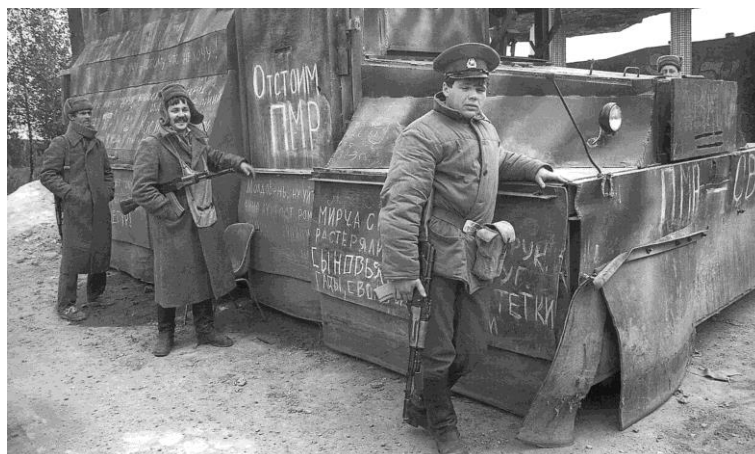
Postul separatiștilor transnistreni pe traseul Dubăsari - Râbnița, februarie 1992.

Pe parcursul lunii martie, între forțele de ordine ale Republicii Moldova și cele separatiste s-au produs numeroase ciocniri. Luptele se duceau în următoarele localități: Cocieri, Corjova, Roghi, Dubăsari, Griogoriopol, Coșnița, Doroțcaia, Tighina, Varnița, Copanca, Fârlădeni, Gâsca, dar și în alte localități de-a lungul Nistrului. Din partea Republicii Moldova au fost mobilizați militari, polițiști și voluntari. Armata Moldovei, organizată în grabă, amplasează câteva unități de infanterie motorizată și artilerie pe direcțiile strategice: Dubăsari, Coșnița, Doroțcaia, Tighina, Varnița, Căușeni.