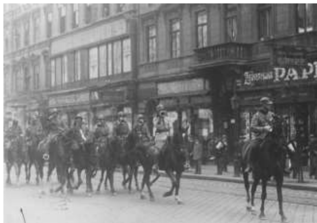
Cavaleriști români pe străzile Budapestei (1919) 23

Despre intrarea românilor în Budapesta, Constantin Kirițescu povestește: „Generalul Rusescu, comandantul călărimii de avangardă,....., în fruntea a patru sute de călăreți a intrat în Budapesta în seara zilei de 3 august (na.1919). A doua zi, la 4 august, armata română a ocupat Budapesta și a înfipt steagul românesc pe cetățuia din Buda, pe palatul regal de pe malul Dunării și pe toate clădirile de seamă ale orașului” 22 .