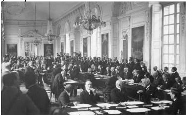
4 iunie 1920: Tratatul de la Trianon – Ungaria recunoștea apartenența Transilvaniei la România 29

La 4 iunie 1920 se semnează la Trianon, în Versailles, tratatul de pace între Ungaria și puterile aliate. Articolul 45 al tratatului de la Trianon prevede: „Ungaria renunță în ceea ce o privește în favoarea României la toate drepturile și titlurile asupra teritoriilor fostei monarhii austro-ungare situate dincolo de frontierele Ungariei astfel cum sunt fixate la art 27 partea a II-a și le recunoaște prin prezentul tratat, sau prin orice alte tratate încheiate, în scop de a regla teritoriile actuale ca făcând parte din România”.