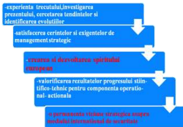
Figura 2 .Modernitatea securității europene

În exprimarea conceptului de securitate europeană nu este nevoie întotdeauna de a adăuga precizarea modernă, aceasta fiind de fapt implicită.