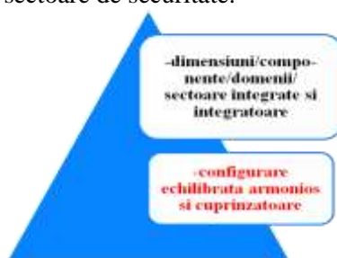
Figura 4. Multidimensionalitate în conținutul securității europene

Multidimensionalitatea (figura 4) este o caracteristică de amploare a conținutului securității europene. Aceasta evidențiază o multitudine de dimensiuni ce dau conținut securității și care în studii de specialitate mai sunt denumite domenii, componente ori sectoare de securitate.