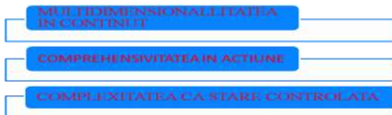
Figura 3. Noi caracteristici

Apreciem că, în strânsă legătură și cu mai multă determinare dinspre modernitate securitatea europeană se manifestă cel mai evident prin trei caracteristici definitorii și perene (figura 3).