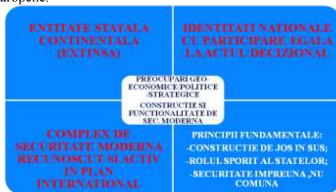
Figura 8. Paradigma securității europene

Noua paradigmă a securității europene (figura 8) rămâne destul de mult ancorată în modelele mai vechi și învățăturile generate de acestea. Dar în ultimii doi-trei ani s-au impus noi elemente și aspecte, dar și unele (re)modelări ale temelor deja cunoscute (prezentate anterior), care reclamă o nouă paradigmă a securității europene.