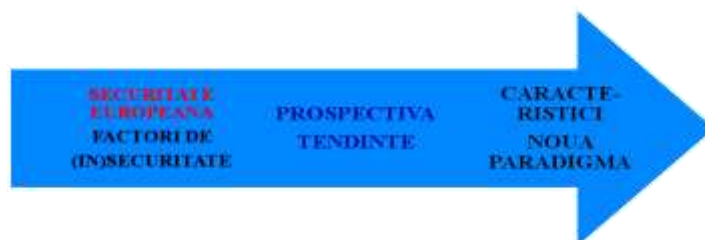
Figura 1. Prospectiva de securitate europeană

evoluțiilor din Europa. Cu alte cuvinte avem de-a face cu o perspectivă de securitate europeană (figura 1).