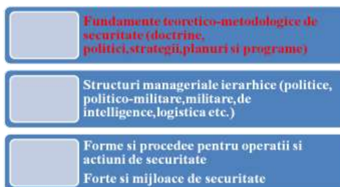
Figura 7. Complex de securitate europeană

Ca rezultat al caracteristicilor securității europene se pune problema ca practica să ceară gestionarea realității actuale într-un complex de securitate europeană (figura 7), cu recunoaștere și participare active la securitatea internațională.