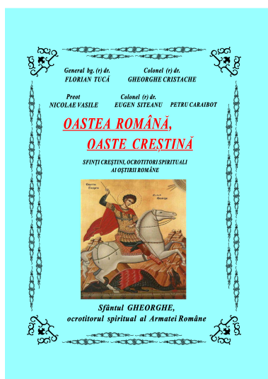
Coperta 1 a lucrării

E ste un adevăr bine cunoscut, dar încă puțin evidențiat în literatura cu tematică istorică, militară și religioasă, că oastea noastră a fost, este și va fi și de acum înainte o oaste creștină . În această privință, prin tradiții și legende, prin izvoare arheologice, istorice și religioase de tot felul, ca și prin articolele, studiile și cărțile publicate până acum, se reflectă o astfel de realitate și anume că în toate timpurile, începând din epoca geto-dacilor și până în zilele noastre, Biserica și Armata au fost și sunt instituții fundamentale și înfrățite ale statalității, că purtătorii și mânăitorii de arme au fost ostași ai datoriei și ai credinței străbune. Relevând acest limbaj adevăr, fostul Patriarh al Bisericii Ortodoxe Române, Preafericitul Părinte Teoctist , avea să sublinieze într-un articol publicat în urmă